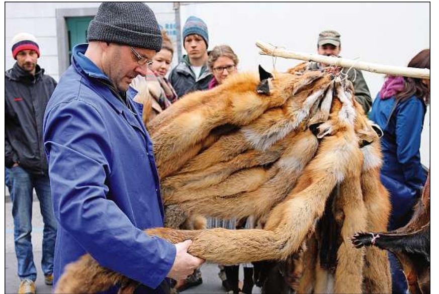
In marcadont giudichescha la qualitat dils fols.