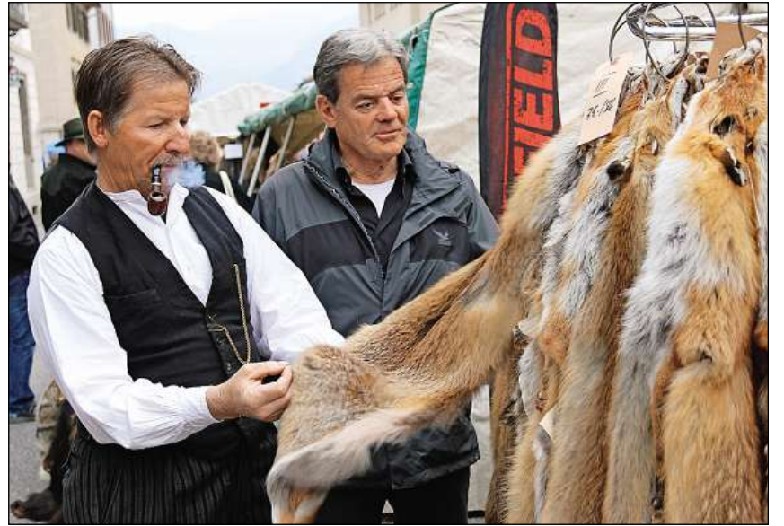
Biars e bials fols d'uolp han pudiu vegnir contemplai a Tusaun.

temps ein vargai. A Tusaun ei vegniu pa- gau la sonda per in bi fol d'uolp 15 francs e per la fiergna 25 francs. Quei ei mintgamai rodund diesch francs pli pauc ch'igl onn vargau. Ils treis marcadonts presentis alla fiera motiveschan quella reduzziun cun la fermezia dil franc svizzer. Ina gronda part dils fols vegn numnadamein vendida egl exte- riur. Quels prezis ein lunsch naven da quels che vegnevan pagai pli baul. Ils onn entuorn la Secunda uiera mundia- la valeva in fol d'ina uolp entochen 100 francs, quels dallas fiergnas schizun 160 francs l'in. Ils davos onns e decennis ein quels prezis sereduci cuntinuadamein, en emprema lingia pervia dallas campa- gnas encunter il commerci cun fols. Las campagnas han giu per consequenza ch'il diever per exempel da mantels cun fols ei oz praticamein inexistentis ell'Eu- ropa centrala. Igl onn vargau ein ro- dund 1700 fols vegni vendi, respectiva- meins cumprai dils marcadonts a Tu- saun. Uonn han ils organisaturs schizun saviu registrar in niev record. Tut en tut ein rodund 2000 fols d'uolp vegni ven- di sco era 250 fols da fiergna e 130 fols d'auters animals sco per exempel tais. Quei record po vegnir attribuius denter auter alla participaziun da catschadurs e catschadurs d'ordeifer il cantun. La qualitad dils fols ei stada per gronda part buna.