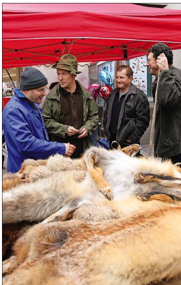
La fatschenta ei fatga – ils fols ein vendi.