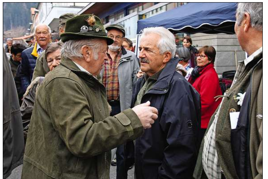
La fiera da fols a Tusaun ei era ina caschun da sentupada.