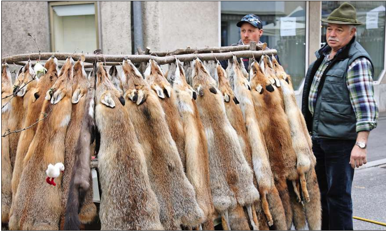
Sa tgei valeta che quels fols han tuts ensemen?