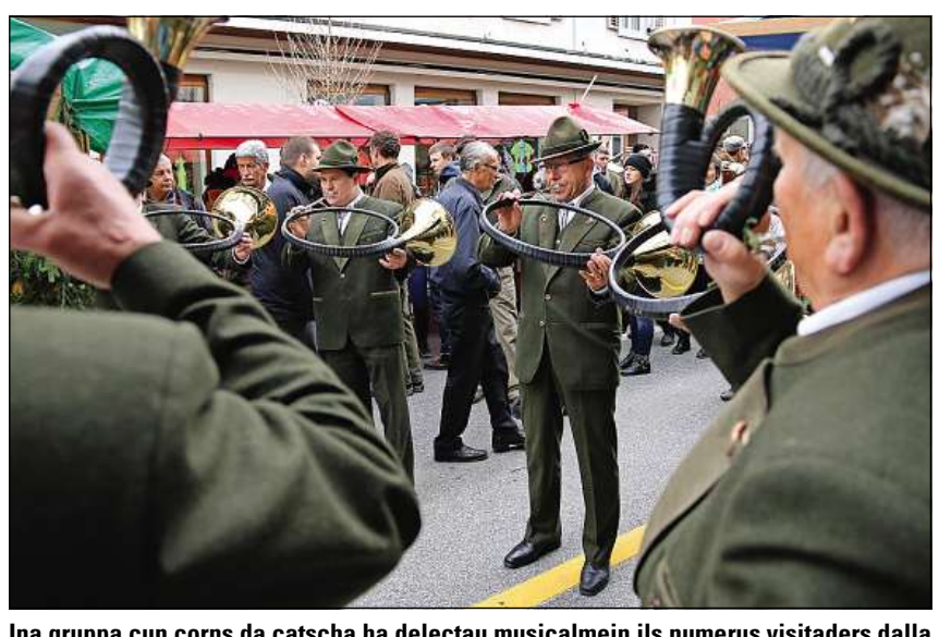
Ina gruppa cun corns da catscha ha delectau musicalmeins ils numerus visitaders dalla fiera.