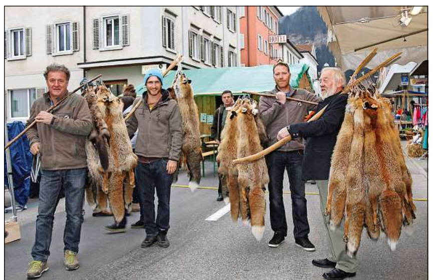
Ils Tuatschins arrivan cun lur predas a Tusaun.